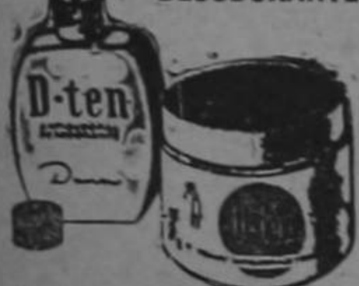
BUENA LA TRANSPIRACION DE LAS AXILAS Y LA PROTECCION POR VARIOS DIAS.