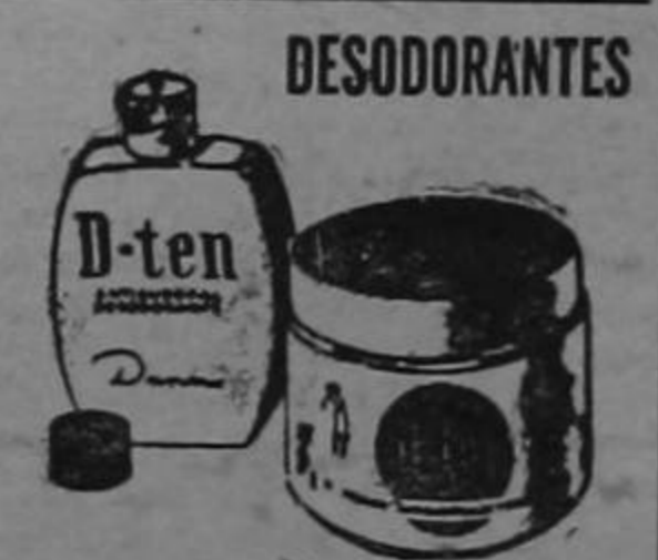
REGULA LA TRANSPIRACION DE LAS AXILAS Y LAS DESODORIZA POR VARIOS DIAS